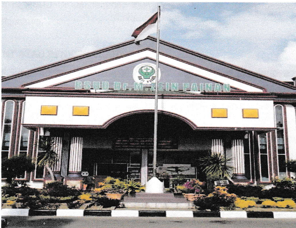
Rumah Sakit Umum Daerah Dr. Muhammad Zein Painan